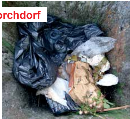
Plastik gehört nicht in die Biotonne

Die betroffenen Liegenschaftseigentümer wurden daraufhin von der Gemeinde über ihr Fehlverhalten informiert. In Zukunft werden die stehengelassenen Biotonnen bei nächster Möglichkeit als Restabfall kostenpflichtig entleert.