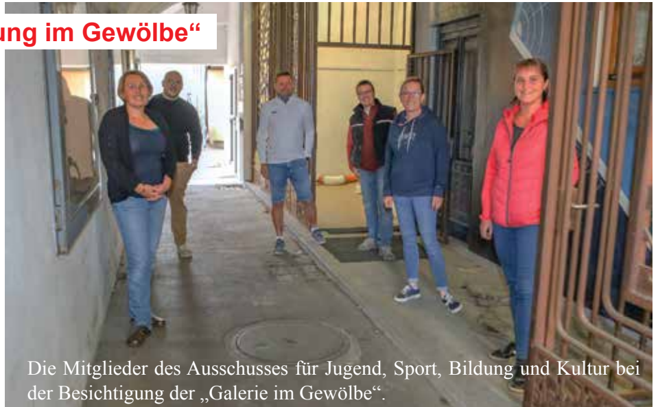
Die Mitglieder des Ausschusses für Jugend, Sport, Bildung und Kultur bei der Besichtigung der „Galerie im Gewölbe“.

Im Durchgang gegenüber der Hoftaverne Ziegelböck befindet sich seit Jahren die „Galerie im Gewölbe“. Viele Kunstinstallationen und Ausstellungen haben bereits in den Fensternischen bzw. im Bereich neben dem Eingang zum Schützenheim stattgefunden. Das „Gewölbe“ ist öffentlich und zu jeder Tageszeit zugänglich. Nun zeigen sich kleinere Abnutzungs-Erscheinungen und der Ausschuss für Jugend, Sport, Bildung und Kultur hat sich dem Thema angenommen.