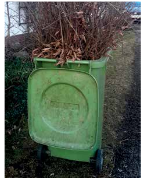
So sollte Strauchschnitt nicht entsorgt werden.

Sa. 8:00 bis 13:00 Uhr; Mi. geschlossen!