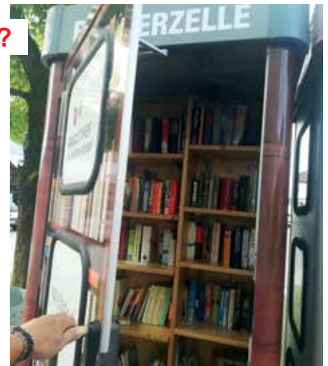
Das Team der Öffentlichen Bibliothek Vorchdorf

Es kann aber nicht sein, dass die Bücherzelle als „Entsorgungszelle“ missbraucht wird: alte Kaffeemaschine, speckige, alte Bücher, die man nur mit den Fingerspitzen anfassen kann, alte Postwurfsendungen, etc. Das Team der Öffentlichen Bibliothek leistet als kultureller Nahversorger in Vorchdorf 4.000 Stunden ehrenamtliche Arbeit im Jahr für die Bibliothek, ist aber nicht für Entrümpelungen zuständig. Die Vorchdorfer Bevölkerung freut sich über die Errichtung der Bücherzelle, und darf keinesfalls für Entrümpelungen missbraucht werden.