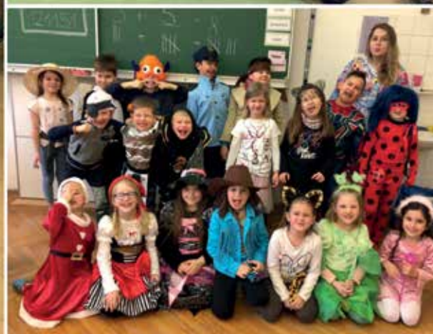
Das Team der Volksschule Vorchdorf freut sich auf ein spannendes zweites