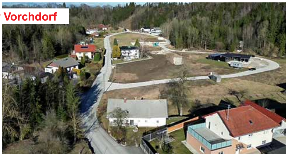
Rechts der Knittelweg

Kein grünes Licht seitens der BH Gmunden gibt es aktuell leider bei anderen Projekten: der Umgestaltung der „Bärnthal/Steinhuber-Kreuzung“ sowie des Kapellenwegs beim Friedhof, der Errichtung eines Mehrzweckstreifens zwischen Schule und Sportplatz, der Verlängerung des Ortsgebiets vor dem „Friedhofs-Kreisverkehr“ sowie Geschwindigkeitsbeschränkungen auf der Feldhamer Straße. Wir bemühen uns aber weiterhin für eine rasche Umsetzung - schließlich geht es um die Verkehrssicherheit in Vorchdorf.